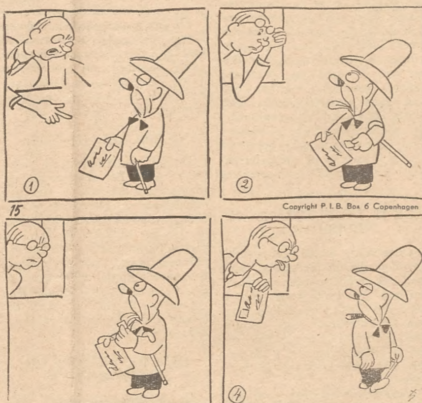
ADAMSON ALS GOEDE PADVINDER DOET ZIJN GOEDE DAAD OP SINT JORISDAG.

Flashlight, fire extinguishers — Meyboom